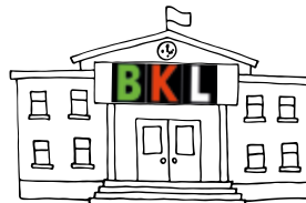
Berufskolleg für Wirtschaft und Verwaltung