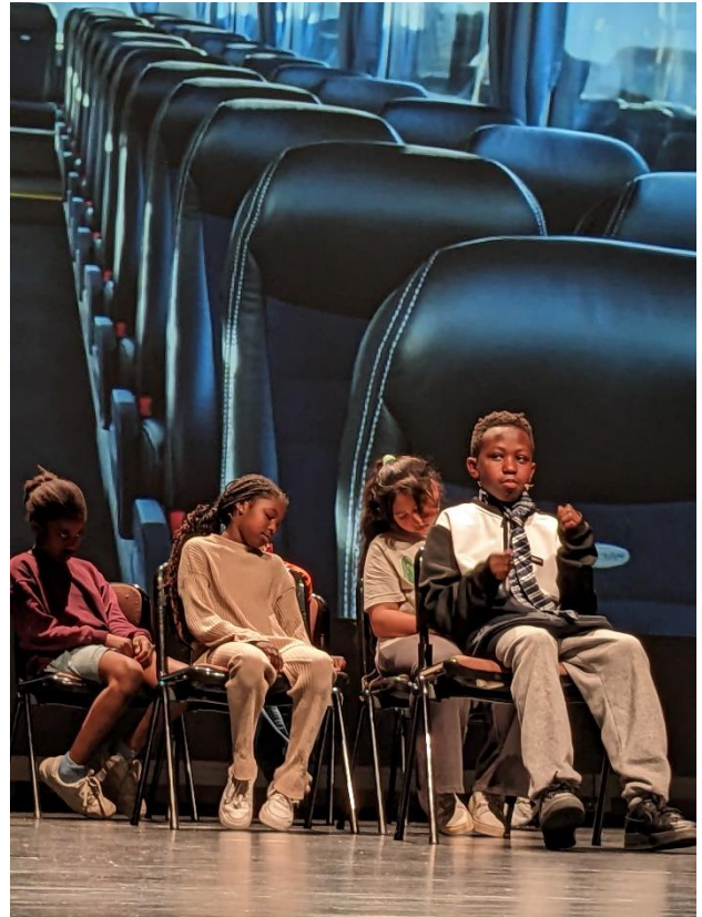
Bild: Schüler*innen der GGS Erich-Klausener-Schule spielten ein selbst geschriebenes Stück

Es ist das erste spartenübergreifende Festival, das die kreativen Leistungen der Schüler*innen in den Bereichen Theater, Musik und Bildende Kunst zeigt.