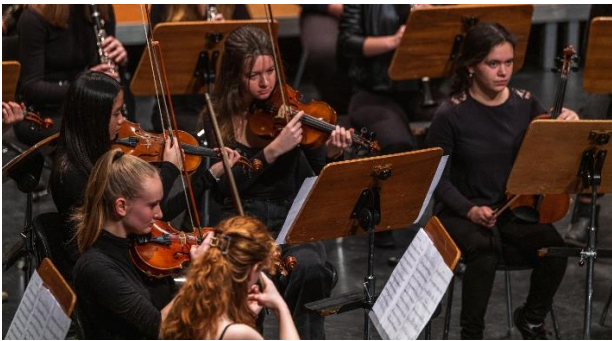
Bild: Blick in das Schulorchester des Freiherr-vom-Stein Gymnasiums.

Workshop-Angebote in den Sparten Musik, Theater und Bildende Kunst für Schüler*innen und Lehrkräfte rundeten das Angebot des Sprungbrett-Festivals ab. Bei der offenen Probe der Bayer Philharmoniker kam so mancher Gast ins Schwärmen. Die Zuhörer*innen durften sich zum Orchester setzen und gemeinsam mit den Musiker*innen das Dirigat der Star-Dirigentin Bar Avni erleben.