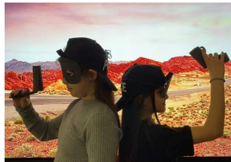
Bild: „Raub in Las Vegas“ bzw. in Alkenrath an der GGS Erich-Klausener-Schule – geschrieben und gespielt von der 4A.

→ Die Theaterprojekte „Raub in Las Vegas“ und „Die Reise durch das Portal“ der 4a und 4b erhielten die lobende Erwähnung der Jury im Rahmen des Sprungbrett-Awards 2024.