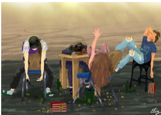
Bild: Die Kabarett-AG des Landrat-Lucas Gymnasiums kündigte ihr Programm mit dieser humorvollen Zeichnung an.

„Sprungbrett – Festival für junge Kultur an Leverkusener Schulen“ heißt das Event, das ab jetzt alle zwei Jahre die drei Wochen vor den Sommerferien zur stadtweiten Bühne macht.