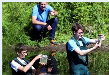
Als Wissenschaftsfuchs geht es auch schon mal ins Wasser.

Wie schon bei den erfolgreich verlaufenen zdi-Sommeraktivitäten, gibt es auch in den Herbstferien wieder online- und Präsenzangebote. Natürlich gelten auch nach wie vor bei den Kursen vor Ort die üblichen Abstands- und Hygienemaßnahmen. So können interessierte Mädchen und Jungen ein eigenes Gadget im 3D-Druck herstellen, Roboter bauen und programmieren oder einen eigenen Pokal herstellen. Mit Unterstützung von Currenta werden sie am Freudethaler Sensenhammer als „Wissenschaftsfuchs“ zum Nachwuchsforscher, ziehen Wasserproben aus der Dhünn und analysieren sie. Dies alles und mehr ist in den Herbstferien in Leverkusen möglich.