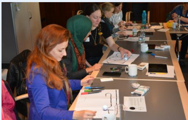
Teilnehmer bei der Coding-Fortbildung

Unmittelbar nach den Medienfachtagen im Mai startet die Vodafone-Stiftung Deutschland in Zusammenarbeit mit dem Kommunalen Bildungsbüro eine erste Fortbildungsreihe, zunächst für Lehrerinnen und Lehrer von Leverkusener Grundschulen. Ziel war es dabei, gemeinsam im Bereich Coding, Programmieren und Robotik die nächsten oder auch die ersten Schritte zu gehen. Sechs Schulen hatten die Gelegenheit, an zwei Fortbildungstagen im Medienstudio am Goetheplatz dabei zu sein. Danach galt es, bei einem begleiteten Projekttag an der eigenen Schule den ersten Praxistest zu machen.