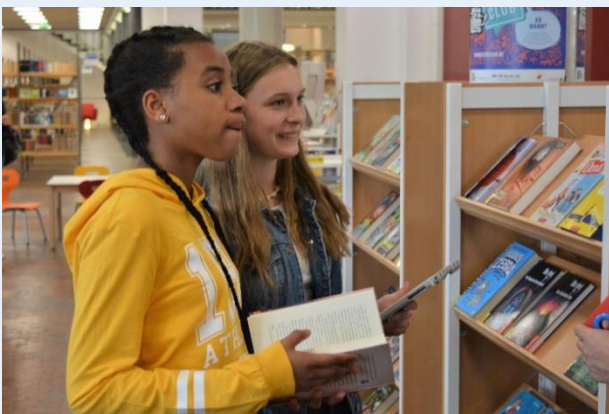
Teilnehmerinnen bei der Stadtbibliothek-Rallye

Bereits zum fünften Mal begrüßten in der vierten und fünften Sommerferienwoche sechs qualifizierte Sprachlernbegleiter insgesamt 60 neuzugewanderte Kinder und Jugendliche zu den „Fit in Deutsch“-Ferienkursen mit intensiver Sprachförderung. Zwei Wochen lang hieß es für die Kinder aus 18 Nationen Deutsch lernen eingebettet in ein abwechslungsreiches Ganztagesprogramm.