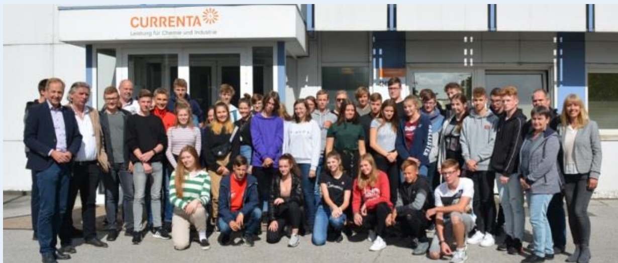
Gruppenbild vor dem Start der Experimente im Schülerlabor

Ausdrücklicher Wunsch der Schülerinnen und Schülerinnen aus Schwedt war es bereits im Vorfeld des Besuchs im Rheinland, den Chempark Leverkusen kennenzulernen und in einem Schülerlabor experimentieren zu können. Gerne war der Chempark bereit, beides für die Gäste aus Brandenburg in Form einer Chempark-Rundfahrt und einer Forscherstunde im Currenta-Schülerlabor des Entsorgungszentrums zu ermöglichen.