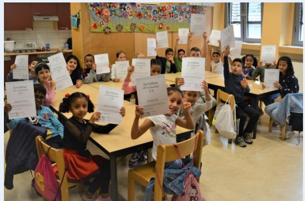
Grundschüler bei Fit in Deutsch in der GGS Opladen

Neben der Gemeinschaftsgrundschule in Opladen unterstützte in diesen Sommerferien auch das Berufskolleg Opladen die Kurse mit der Bereitstellung von Räumlichkeiten und machte so die Kurse in den Sommerferien erst möglich. In der Opladener Grundschule war es bereits der vierte erfolgreiche Durchlauf dieser Ferienkurse.