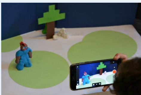
Mit der Slow Motion App werden Geschichten erzählt – egal mit welchen Sprachkenntnissen

Neben Ausflügen zu wichtigen Lernorten in Leverkusen wie der Stadtbibliothek und dem NaturGut Ophoven kam auch die kreative Förderung nicht zu kurz. Die Kinder und Jugendlichen nutzen dafür die App „Slow Motion“, mit der man kleine Kurzfilme mit selbstgebastelten Szenarien herstellen kann. Heraus kamen spannende Geschichten von der Lovestory bis zum Fußballturnier.