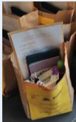
Foto: Tütenpacken im Jugendhaus Rheindorf