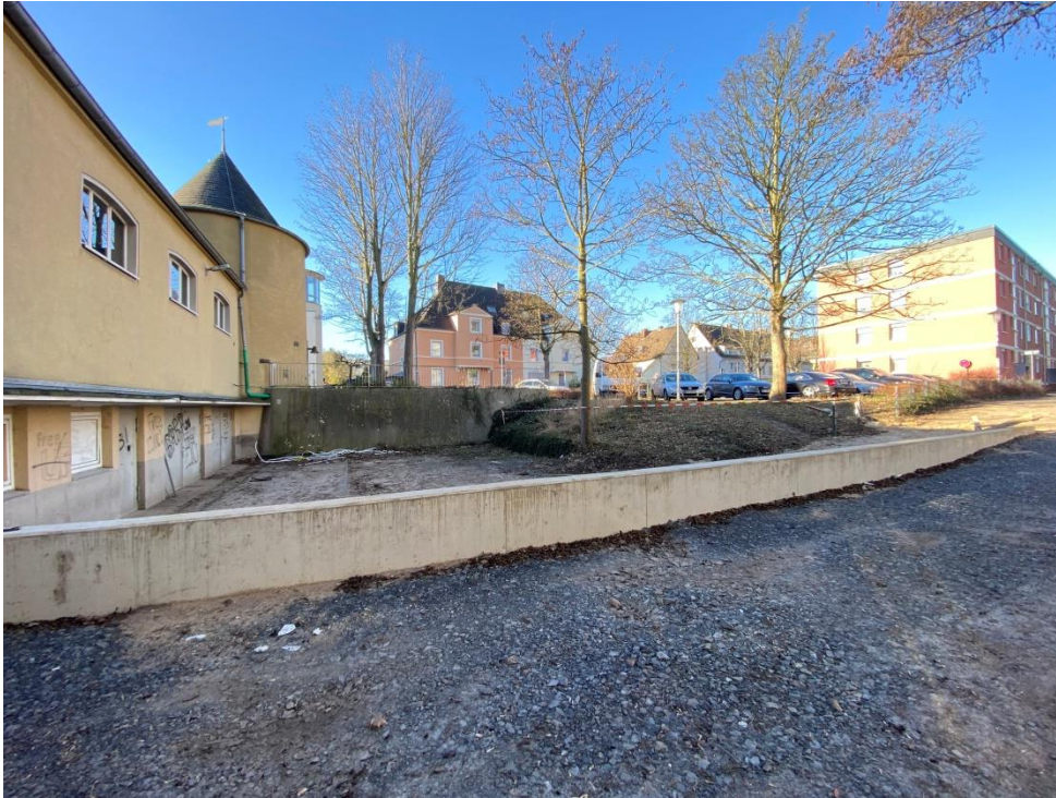
Schutzwand im Außengelände